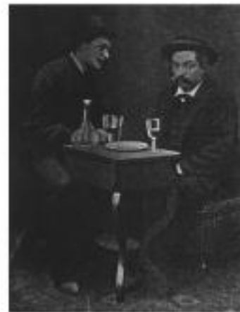
4. Emile Cohl visitant Gill à l'asile de Charenton (1884)