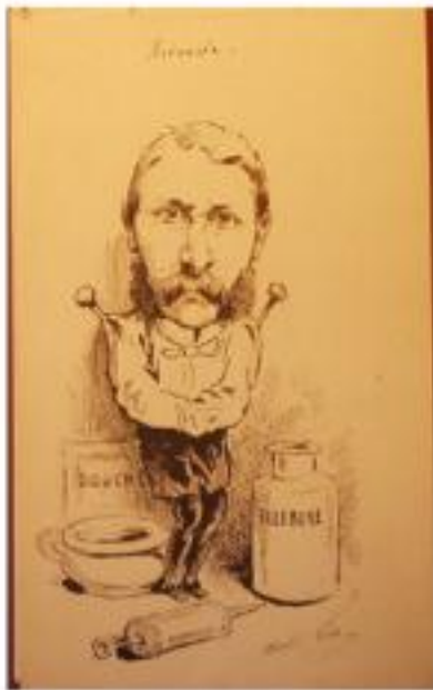
6. "Revanche" réalisé à l'asile de Charenton (date inconnue)