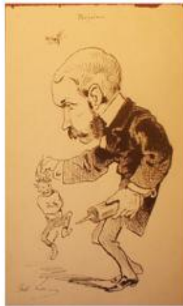
7. "Diapirus" réalisé à l'asile de Charenton (date inconnue)