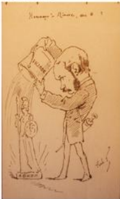
8. "Hommage à Minerve" inédit réalisé à Charenton (date inconnue)